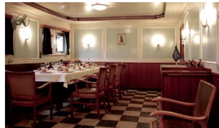
2008 © Michael Bera