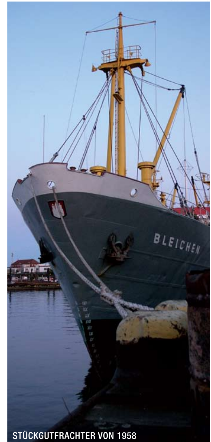
STÜCKGUTFRACHTER VON 1958