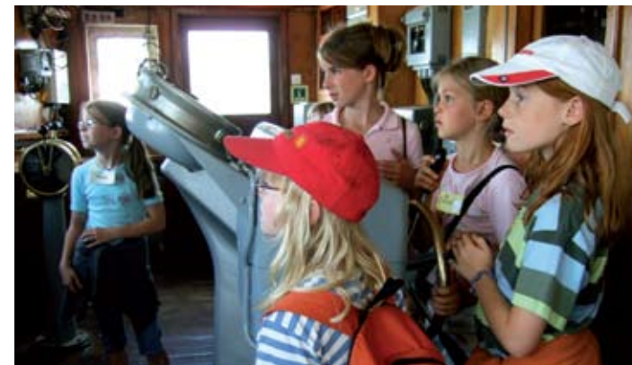
2008 © Museumsdienst Hamburg